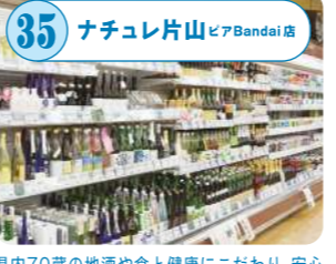
35 ナチュレ片山 ピアBandai店 県内70蔵の地酒や食と健康にこだわり、安心して無添加の商品を厳選。ナチュラルチーズや生ハムは切り立ての美味しさが楽しめる。