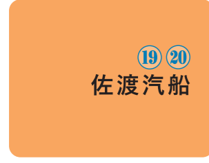
19 20 佐渡汽船 佐渡の海産物を使用した「岩のりながもそば」、新潟あごだし辛味噌ラーメンなど新潟・佐渡らしいバラエティ豊かな食事メニュー。