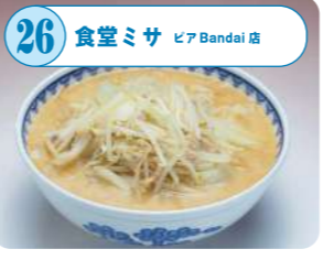
26 食堂ミサ ピアBandai店 新潟5大ラーメンの1つ・新潟濃厚味噌ラーメン。白味噌をベースにタマネギの甘みやニンニクの香りが食欲をそえる。