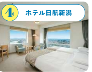
4 ホテル日航新潟 日本海側唯一の高層ビル内にあるホテル。客室は、新潟市街や日本海・佐渡島の眺望が遠くまで見渡せる。