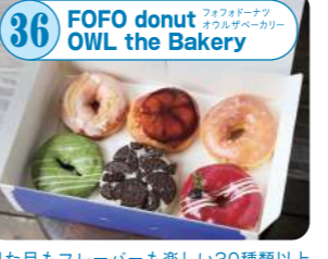
36 FOFO donut OWL the Bakery 見た目もフレーバーも楽しい30種類以上のドーナツをご用意。常に新しいドーナツを提供し、お客様にワクワクをお届け！