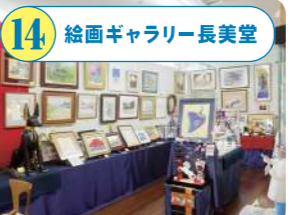
14 絵画ギャラリー長美堂 日本画、油絵、木版画、リトグラフなどの絵画のほか、高級洋食器や貴金属も販売。お買取りのご相談も受付中。