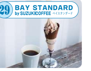
29 BAY STANDARD by SUZUKICOFFEE 50種類以上の豆や器具を扱うコーヒー専門店。日替りのホットコーヒーやお好みに合わせてコーヒー豆をご提案も。