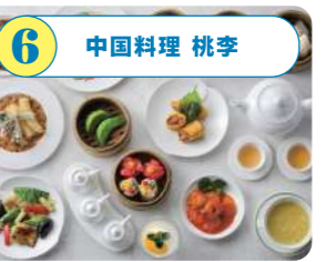
6 中国料理 桃李 ホテル日航新潟の運営する中華料理店。素材を生かした広東料理を中心に、幅広い年齢層の方も楽しめるメニューが揃う。