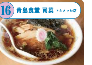
16 青島食堂 司菜 トキメキ店 新潟5大ラーメンの一つ、長岡発祥の生姜醤油ラーメン。スープによく絡む中太麺とチャーシューが絶品。行列必至の人気店。