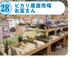
28 ビカリ産直市場 お富さん 旬の新鮮野菜や果物がそろう農産物直売所。笹団子や新潟限定土産が充実し、観光客から地元の方まで楽しめる魅力が満載。