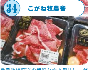
34 こがね牧農舎 地元牧場直送の新鮮な肉と製法にこだわった畜産加工品を提供する、新鮮で安心しておいしい生産者直送型の直販店。