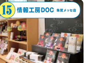
15 情報工房DOC 朱鷺メッセ店 名刺、コピー、チラシ、パンフレットなど印刷物のご相談ならお気軽に。新潟に関する紙製品、オリジナルの新潟土産も多数。