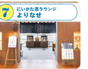
7 にいがた酒ラウンジ よりなせ ホテル日航新潟のフロントカウンターで購入する専用コインで、新潟の日本酒をセルフサービスのサーバーで楽しめるラウンジ。