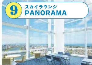
9 スカイラウンジ PANORAMA ランチやドリンク、アルコールを楽しめる喫茶。信濃川の土流や佐渡島を眺望しながら、ゆったりとした時間をどうぞ。