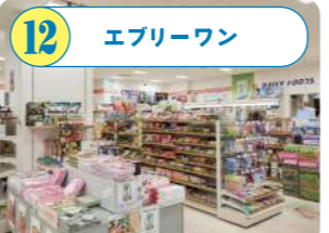
12 エブリワン 朱鷺メッセのコンビニエンスストア。新潟市内で作られるお弁当やパン等多様な食品から、オーガニック食品や新潟土産まで。