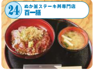
24 めか釜ステーキ丼専門店 百一膳 めか釜ステーキ丼専門店。めか釜とは、お米の粒殻を燃料に使った炊き方のこと。自家製ステーキソースとご飯の相性抜群！