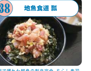
38 地魚食道 瓢 新潟で獲れた鮮魚の刺身定食、ちらし寿司、焼魚、煮魚等を提供。約70席の客席から新潟漁港や朱鷺メッセ等の景色を一望できる。