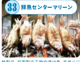
33 鮮魚センターマリン 鮭製品、自家製の干物や漬け魚、手作りにこだわった総菜や弁当類を豊富に取り揃えて、日本海の旨さをそのままお届け。