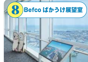
8 Befco ばかうけ展望室 地上約125m、日本海側唯一の高さを誇る展望スペース。市街地、日本海、佐渡島、五頭連峰などの景色を360度パノラマで。