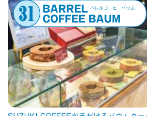
31 BARREL COFFEE BAUM SUZUKI COFFEEが手がけるバウムクーヘン専門店。日常のコーヒーシーンに合うこだわりのしっとりしたバウムクーヘンが◎