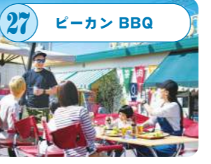
27 ピーカン BBQ アメリカ製高級グリルで最高のBBQ体験を！手ぶらでBBQができる厳選食材コース、飲み放題コース等ご用意。(要予約)