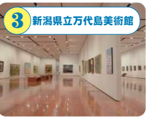
3 新潟県立万代島美術館 国内外の美術を取り上げる企画展を通じて、芸術文化に親しむ機会を提供する。展覧会を見た後は、ショップでお買い物も楽しんで。