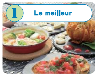
1 Le meilleur 昼から夜まで海鮮や肉、豊富なカクテルを取り揃えたメニューが自慢。昼は明るい日差しの中で、夜はロマンチックな景色を楽しんで。