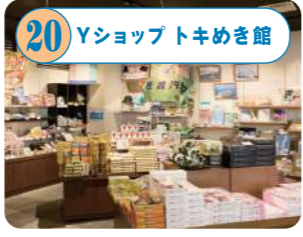
20 Yショップトキメキ館 海産物や地酒、銘菓など新潟・佐渡の名産品、佐渡旅行を楽しめるアイテムが豊富。旅の途中で役立つ商品も販売中。