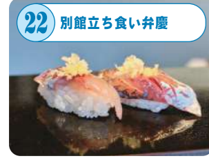
22 別館立ち食い弁慶 弁慶の味と価格をそのままに、気軽な立ち食いスタイル。約20種類の地酒や季節の地酒の飲み比べと目の前で握る寿司が◎