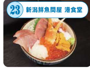
23 新潟鮮魚問屋 港食堂 万代島で水揚げされた新鮮な地魚を扱う新潟中央水産市場株式会社直営の食堂。朝獲りの鮮魚を使った海鮮丼や漁師飯が人気。