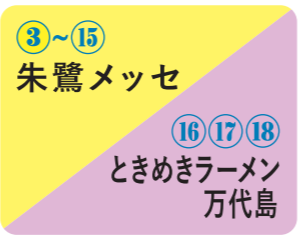
3~15 朱鷺メッセ 16 17 18 ときめきラーメン 万代島