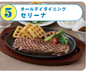
5 オールデイダイニング セリーナ ホテル日航新潟の運営する明るく開放的なオールデイダイニング。朝食からランチ、ディナーと多彩なお料理をどうぞ。