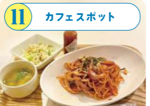
11 カフェスポット 朝9時のモーニングから種類豊富なランチや喫茶まで、万代島を訪れるすべての方がほっと一息つくことのできるカフェ空間。