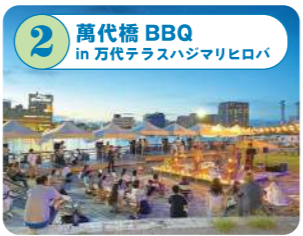
2 萬代橋 BBQ in 万代テラス&マリヒロバ 街中マリバーサイドの最高の景色でBBQを！手ぶらプラン、持ち込みプラン、どちらもOK。ファミリー、わんちゃん連れ、団体でも楽しめる。