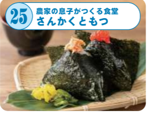
25 農家の息子がつくる食堂 さんかくともつ 米の美味しさがしっかり味わえる新潟一のおにぎりを提供中。こだわりは「炊き立て・握りたて・具沢山」。