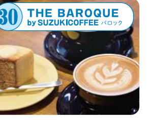
30 THE BAROQUE by SUZUKICOFFEE コーヒー豆を通常の2倍多く使用した濃厚な味わいのバリックラテが看板メニュー。濃厚なカフェラテを楽しみたい方に。