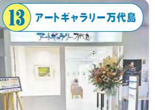
13 アートギャラリー万代島 新潟にゆかりのある作家たちの作品を展示。日本画、陶芸、油絵等訪れるたび、さまざまなアート作品鑑賞に触れられる。