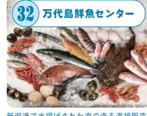
32 万代島鮮魚センター 新潟港で水揚げされた海の幸を直接販売。旬の魚介類が毎日入荷し、寿司や刺身・魚卵・惣菜等バラエティに富んだ商品が並ぶ。