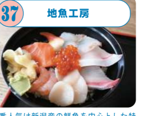
37 地魚工房 一番人気は新潟産の鮮魚を中心とした特製の海鮮丼。日替りの焼き魚や煮魚、シーフードカレーなど旬の魚を楽しめる。